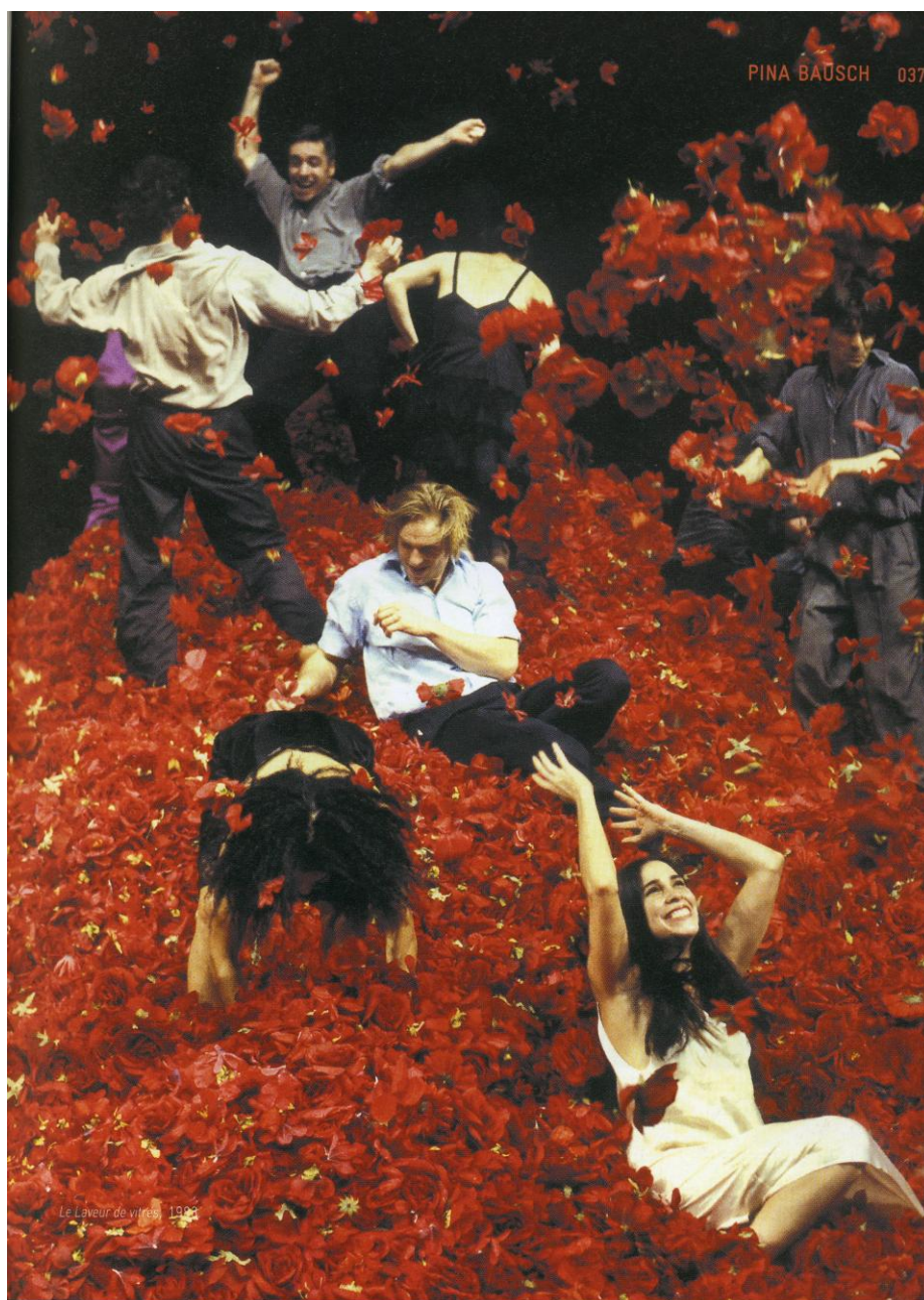
Le Laveur de vitres, 1988 Pina Bausch