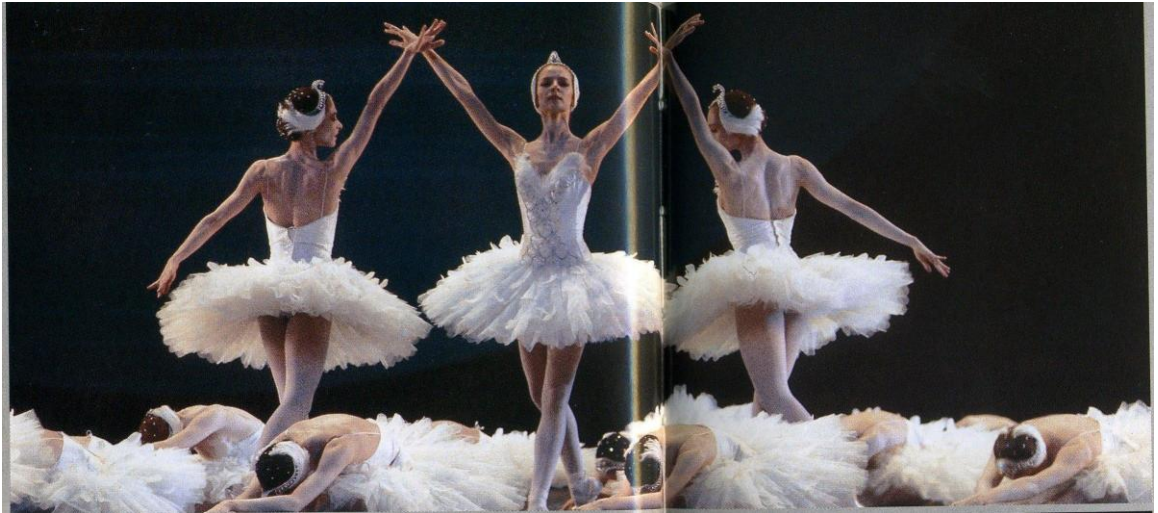
Le Lac des Cygnes, Opéra de Paris, juillet 1992